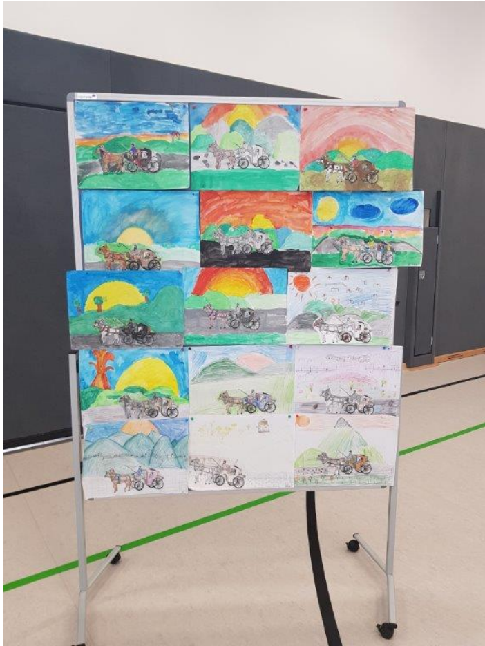
Mendelssohn auf Reisen!